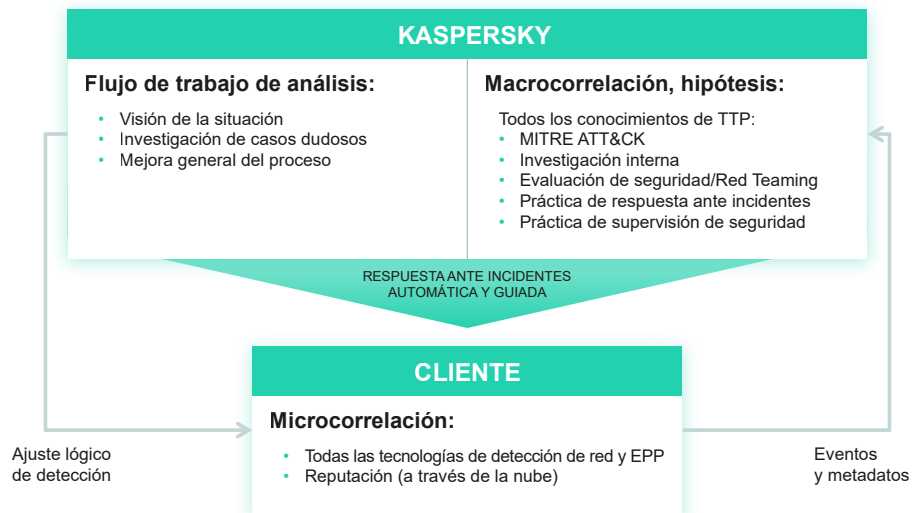
Figura 3. Flujo de análisis de incidentes en Kaspersky MDR

SOC de Kaspersky analiza los datos recibidos mediante el uso de todos nuestros conocimientos sobre tácticas, técnicas y procedimientos utilizados por adversarios en todo el mundo (Figura 3). Recopilamos información de una investigación constante de amenazas, la base de conocimientos MITRE ATT&CK, docenas de compromisos de evaluación de seguridad por año realizados en todos los mercados verticales y prácticas continuas de supervisión de seguridad y respuesta ante incidentes. Este conocimiento constantemente actualizado garantiza una detección correcta de amenazas de malware furtivas y entrega una completa conciencia circunstancial, lo que nos permite verificar los casos y proporcionar a los clientes una orientación clara y factible.